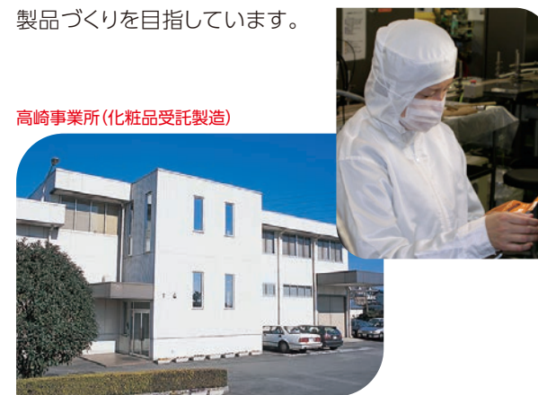
高崎事業所(化粧品受託製造)

また、お得意先への新規商品のご提案にも力を入れ企画から開発、製造まで最新技術でお手伝いします。お客様の美と健康にかかわる分野だけに、つねにアイデア・技術を結集しながら、より安全で高品質な製品づくりを目指しています。